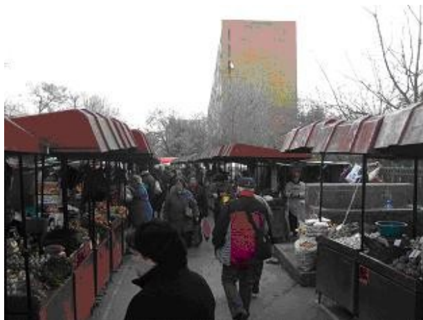
Vedere din piata