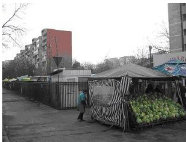
Vedere zona Nord – Vest