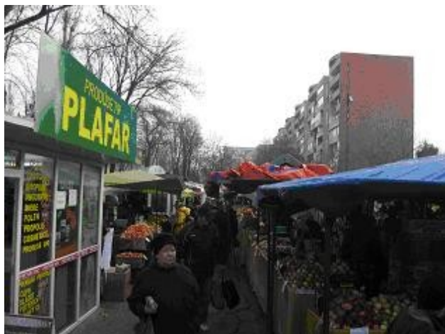
Vedere din piata

“Reamenajare piața Drumul Taberei din Bucuresti, str. Drumul Taberei nr. 44 B, sector 6”