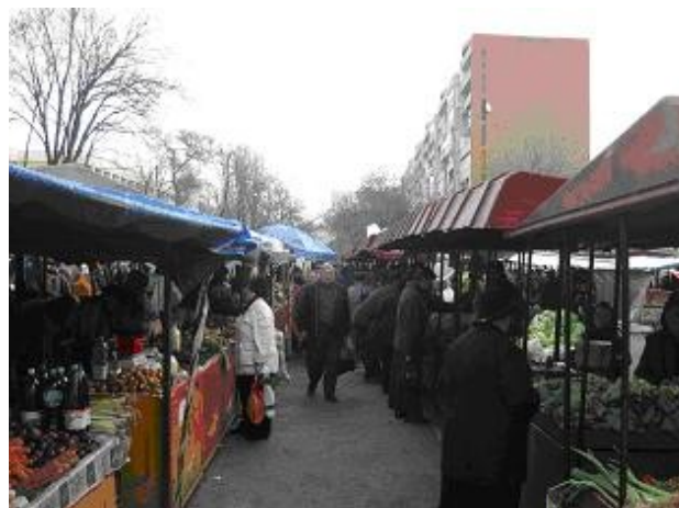
Vedere din piata