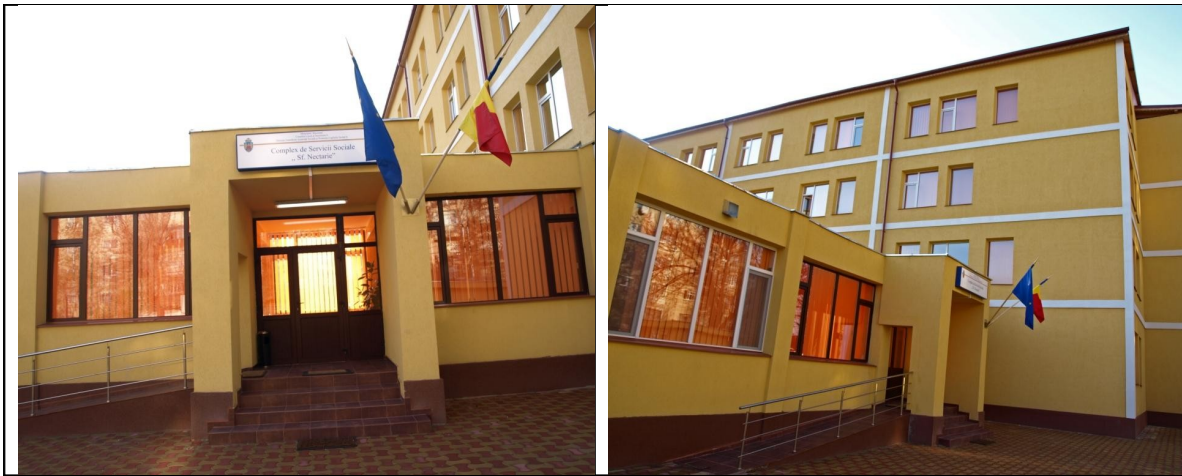
Complexul de Servicii Sociale "Sf. Nectarie" în care va fi amplasat cabinetul

Complexul de Servicii Sociale „Sf. Nectarie” este unitate de asistență socială, fără personalitate juridică, în cadrul Direcției Generale de Asistență Socială și Protecția Copilului Sector 6 (D.G.A.S.P.C. Sector 6), înființat prin Hotărâre a Consiliului Local al Sectorului 6, București. Complexul de Servicii Sociale „Sf. Nectarie” funcționează în Municipiul București, la adresa din B-dul Uverturii, nr. 81, Sector 6.