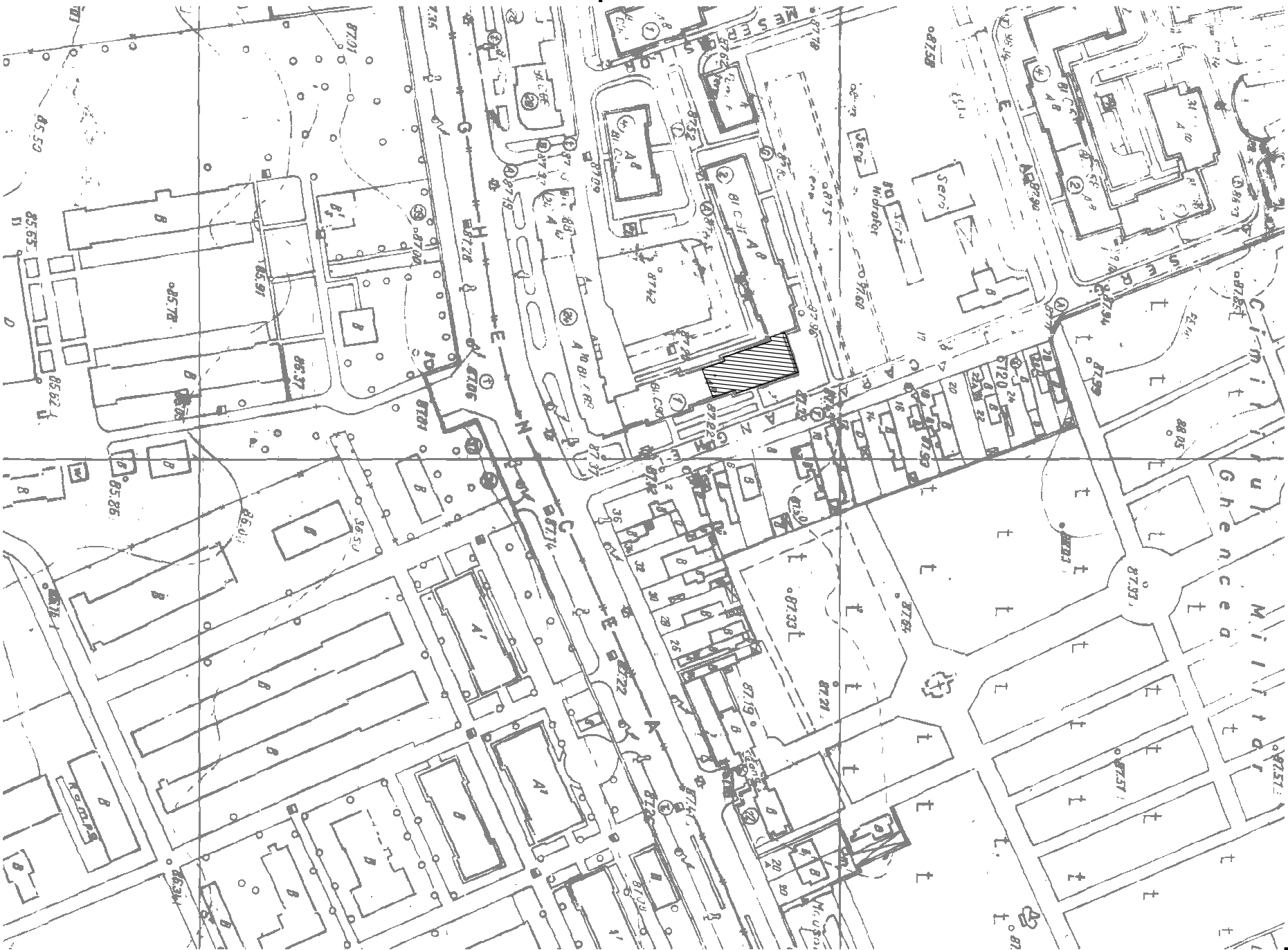
PLAN DE SITUATIE, SCARA 1:2000